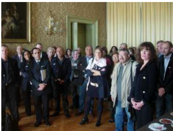
Cocktail « Hôtel de Ville »