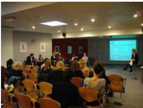
Table Ronde « Cité des Métiers »